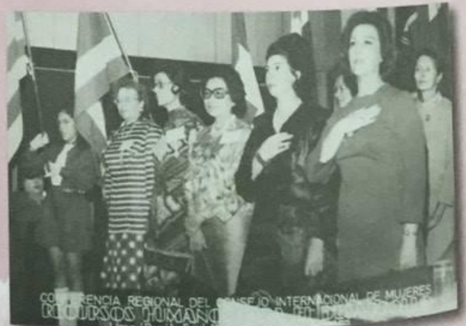
CONFERENCIA REGIONAL DEL CONSEJO INTERNACIONAL DE MUJERES DE CURSOS HUMANOS