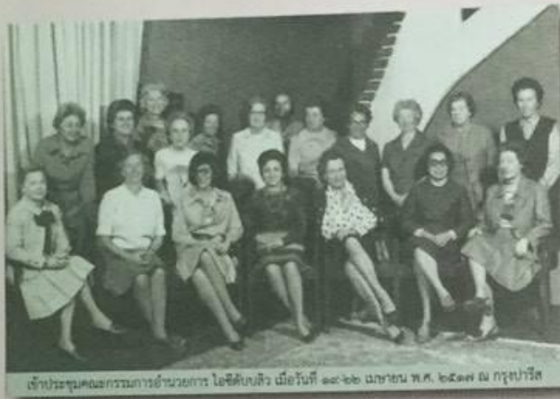
เจ้าประทุมและกรรมการอำนวยการ ไอซีดับลิว เมื่อวันที่ ๑๑-๑๒ เมษายน พ.ศ. ๒๕๑๗ ณ กรุงปารีส

หมู่คณะด้วย เป็นต้น ความคิดของการอบรมผู้นำเยาวชนในสมัยนี้ ภายหลังรัฐบาลได้รับงานชิ้นนี้ไปดำเนินการต่อ